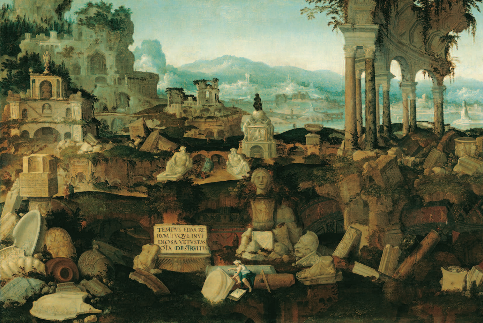
Herman Posthumus, Landschap met Romeinse ruïnes , 1536, Prinselijke verzamelingen Liechtenstein, GE 740.