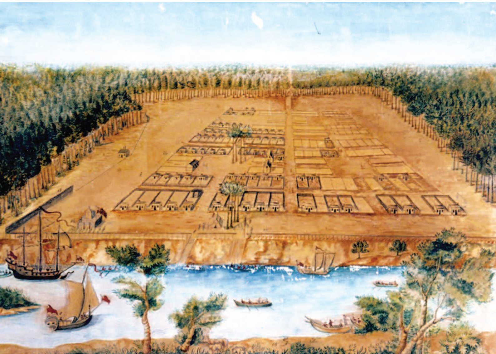
A View of Savannah as it stood on the 29th of March 1734 door Peter Gordon.