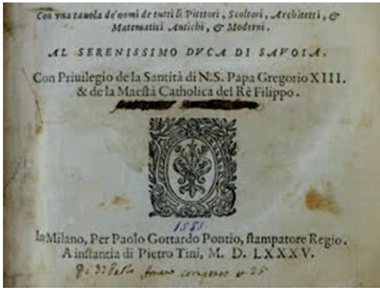
Title page with three types of writing, from top to bottom: Mariano-hand, scratched out; Leonardo-hand, numbers in blue ink; Andrea-hand, line in brown ink.

“Hidden in the basement of the KNIR is a treasure waiting to be explored...”