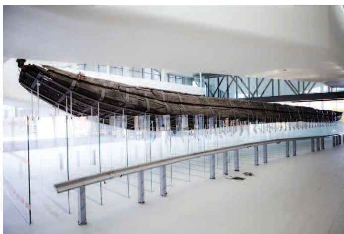
Het schip De Meern I uit circa 200 na Christus.

Een mooie gelegenheid om deze bijzondere archeologische ontdekking van dichtbij te zien!