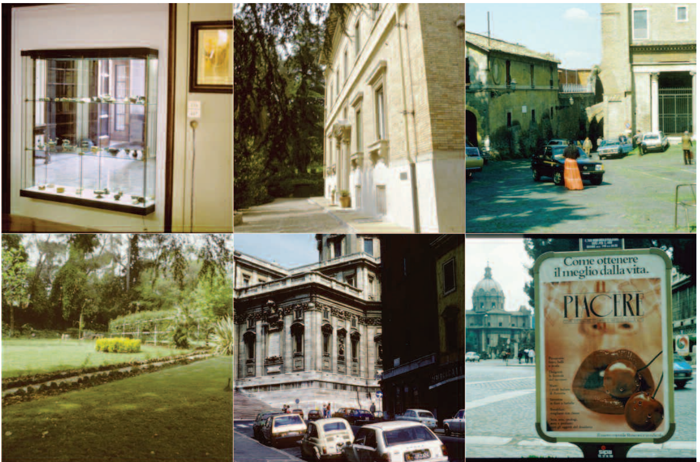
Rome door de lens van Tjeerd Pot

Heeft u leuke Romeinse foto's uit een al dan niet zwart wit verleden die de moeite van het delen waard zijn? Laat het ons weten!