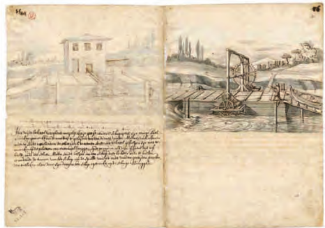
Cornelis Meyer e Gaspar van Wittel, Modo di far navigabile il fiume Tevere da Perugia a Roma. Roma, Biblioteca dell'Accademia Nazionale dei Lincei e Corsiniana